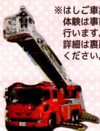
はしご車展示・搭乗体験