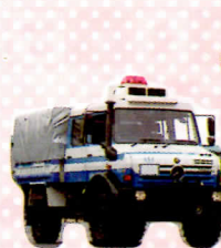
震災対応活動車(警察車両)展示