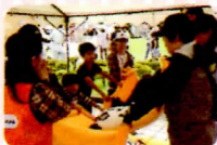
毛布で担架タイムトライアル