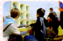
水消火器的あてゲーム