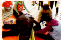
ジャッキアップゲーム