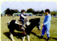
ポニー乗馬体験 (小学校3年生以下)